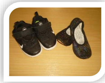
Feste Sportschuhe oder Schläppchen