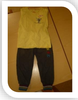
T – Shirt & Sporthose